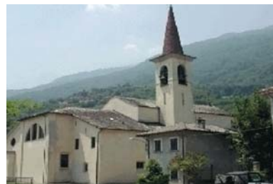
5 Pianello Lario: l' "embrione" dell'opera Don Guanella.