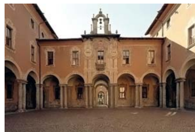
2 Como: Collegio Gallio ove fece gli studi umanistici.