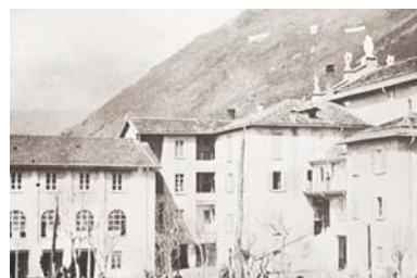
6 Como: Casa della Provvidenza - inizi.