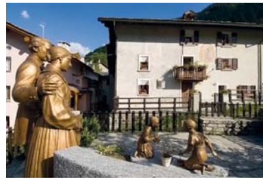
1 Fracisciolo di Campodolcino: Casa natale di San Luigi Guanella.

Dopo la morte di Don Luigi Guanella crescono la stima e la venerazione sia tra i suoi fedeli ma anche nella Chiesa tutta. È proclamato Beato da Papa Paolo VI il 25 ottobre 1964 ; Papa Benedetto XVI il 23 ottobre 2011 in Roma lo dichiara Santo .