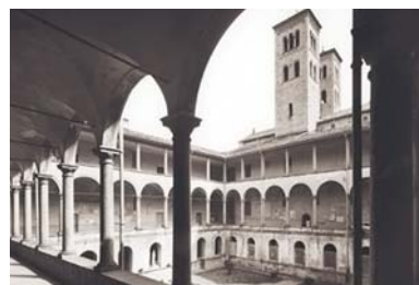
2 Como: la Basilica e l'antico seminario di Sant'Abbondio.