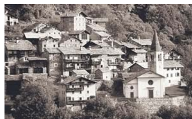
3 Savogno: Luogo del suo ministero sacerdotale (1866 - 1875).