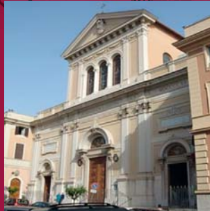
ROMA: Basilica di San Giuseppe al Trionfale edificata da San Luigi Guanella con il Complesso delle Opere Parrocchiali