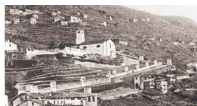
4 Traona: ex - Convento di san Francesco - prima "Fondazione" di San Luigi Guanella (1878 - 1881).